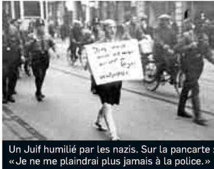
Un Juif humilié par les nazis. Sur la pancarte : « Je ne me plaindrai plus jamais à la police. »