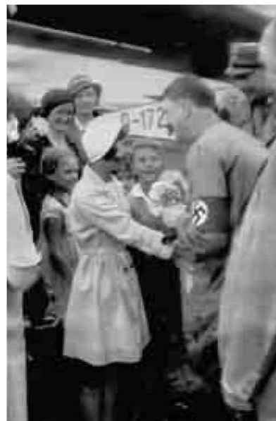
Une photo du cahier d'écolier d'Edgar Hitler. Hitler n'aimait pas les enfants.